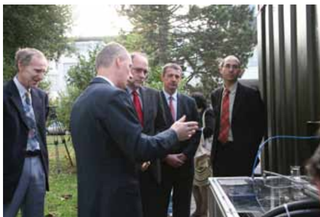
Slika 4: Predstavitve mobilne bivalne kogeneracijske enote ministru za razvoj, Institut »Jožef Stefan«, oktober 2009

Sodelavci odseka, ki so sodelovali pri izvedbi projekta »Razvoj demonstracijskega prototipa sistema kogeneracije mobilne (kontejnerske) izvedbe za vojaške namene na osnovi gorivnih celic – GCCOGEN« so od Slovenske vojske dobili posebno priznanje za zelo kvalitetno opravljeno delo.