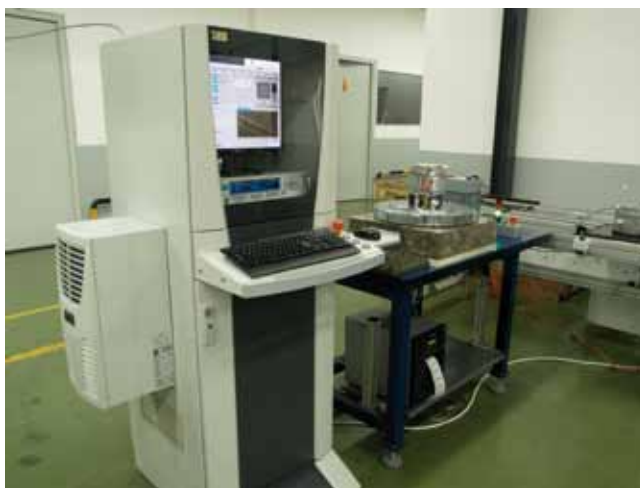
Slika 5: Diagnostični sistem za končno kontrolo elektronsko komutiranih elektromotorjev

Referat avtoric: dr. Nadje Hvala, Teodore Miteve in dr. Dolores Kukanje, ki je nastal v sklopu raziskav projekta 6. okvirnega programa PRISM in obravnava optimizacijo trajanja šarž pri procesu polimerizacije v podjetju MITOL, je bil med devetimi nominiranimi referati izbran za najboljši prispevek na mednarodni konferenci »Industrial Simulation Conference«.